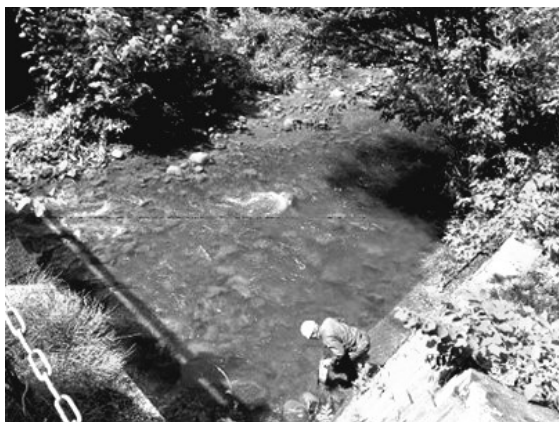
赤川～富士見橋間の水位測定

訓練には松尾管理事務所の職員全員が参加。JOGMECは、ベテラン職員から若手職員にノウハウが確実に承継され、全ての職員が迅速に対応できると説明する。